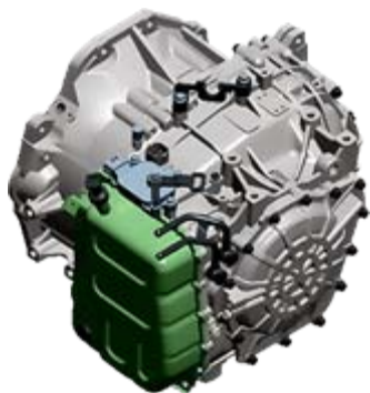
Новая 6-ти ступенчатая автоматическая трансмиссия