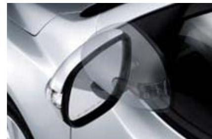
Электропривод складывания зеркал заднего вида