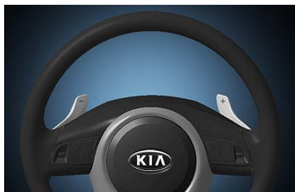
Подрулевые "лепестки" переключения передач